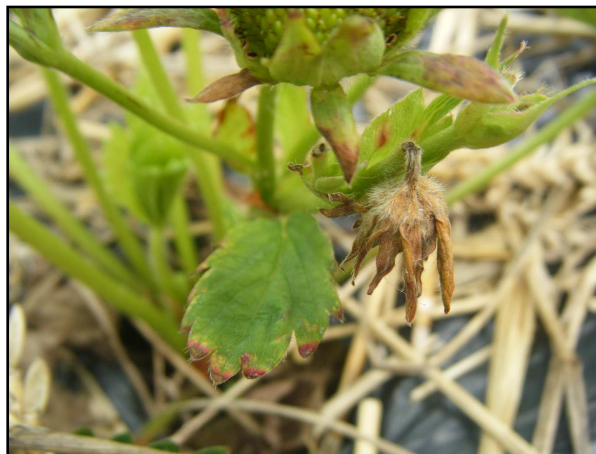
Fig.2 Dégât sur fleur