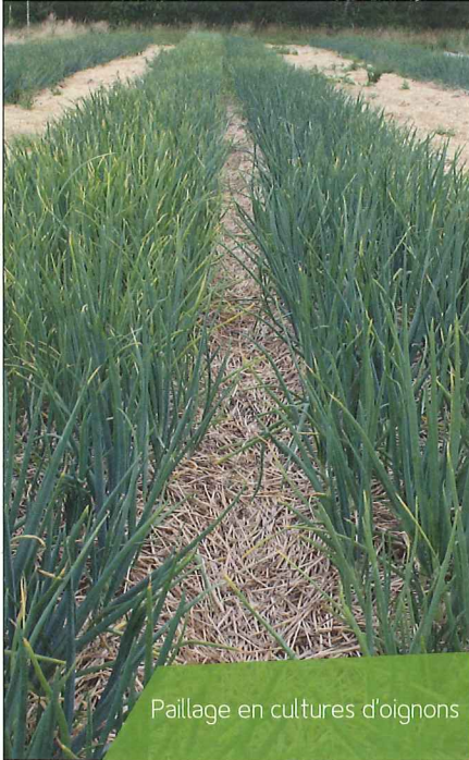
Paillage en cultures d'oignons