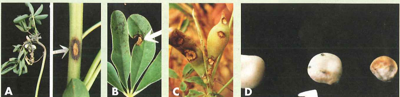
Figure 1 : Symptômes d'infection par C. lupini sur lupin blanc : A) tiges courbées et chancre rose auréolé, B) taches beiges auréolées de brun sur les feuilles, C) chancres roses auréolés de brun sur les gousses, D) graine saine (à gauche) et graines infectées par C. lupini (à droite). Gondran J, Bournoville R, Duthion C (1994) Identification of diseases, pests and physical constraints in white lupin. INRA.

présence de cette maladie réduit le nombre de gousses produites par la plante (Figure 1-C), influençant ainsi directement le rendement en grains. Elle cause également des déformations des grains et la réduction de leur taille (Figure 1-D). En cas de forte attaque d'antracnose, quel que soit le stade de développement de la plante, celle-ci flétrit et meurt. Face à cette redoutable maladie, différents moyens de lutte ont été étudiés, principalement en Australie, le plus grand producteur de lupin au monde, mais également en Allemagne. La première méthode de lutte consiste à utiliser des variétés résistantes. Ainsi, des croisements ont été réalisés parmi différents cultivars afin d'introduire des gènes de résistance chez les lupins blanc, bleu ou jaune. Des variétés résistantes existent actuellement sur le marché mondial mais ne sont pas forcément adaptées à nos conditions de culture. De plus, cette résistance n'est pas totale et est influencée par la température.