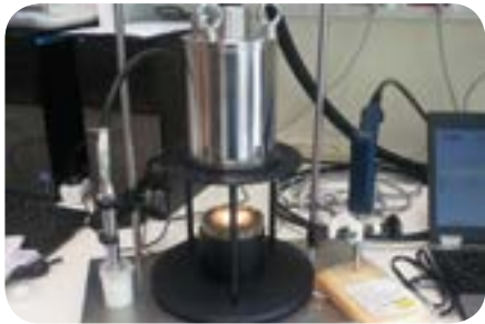
Contrôle par spectroscopie proche infrarouge de la composition des produits agro alimentaires (lait, pellets d'aliments pour animaux, fromage).

Le besoin économique de développer de nouvelles méthodes d'analyse rapide et peu coûteuse se ressent de plus en plus chez les industriels et les agriculteurs.