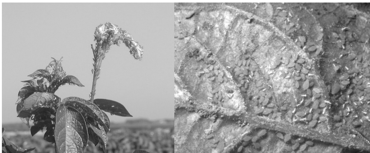
Photos 1 et 2 : colonie de M. euphorbiae sur tige florale (gauche) et d' Aphis nasturtii sur feuille