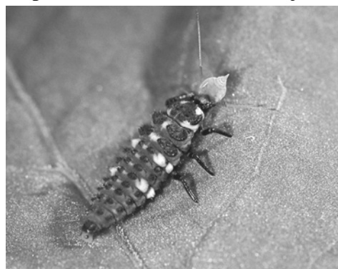
Photo 4 : larve de coccinelle dévorant un puceron

Les larves de coccinelles, de syrphes et de chrysopes, sont des prédateurs très voraces de pucerons. Une larve de prédateur peut dévorer jusqu'à 500 pucerons en une dizaine de jours, temps nécessaire au passage à l'âge adulte. Les prédateurs ne sont attirés dans les cultures de pomme de terre que lorsque les populations de pucerons sont suffisantes, de l'ordre minimum de 2-3 pucerons/feuille, ce qui explique qu'on ne les rencontre en général qu'à partir de début juillet, les populations de pucerons étant bien souvent inférieures à ce seuil en juin. Ils ont une action avant tout curative et sont capables, en une semaine, de décimer des populations complètes de pucerons, même importantes.