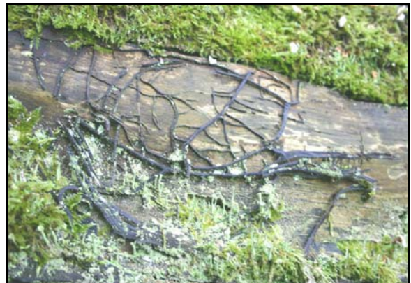
Rhizomorphes sur tronc de saule