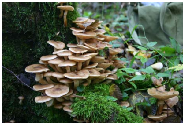
Carpophore à la base d'un tronc d'aulne