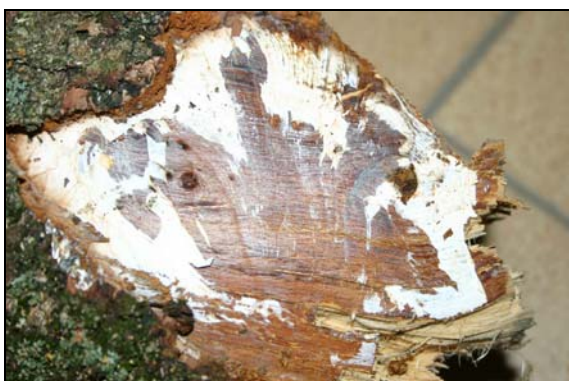
Mycélium en « palmettes » sur tronc de bouleau