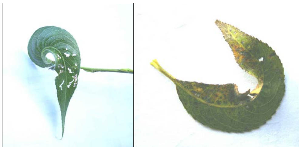
Feuilles de saule déformées par attaque de Marssonina