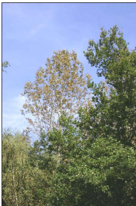
Houppier de peuplier dégarni par suite d'attaque du feuillage