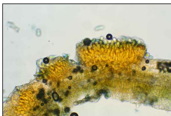
Grossissement sur une pustule localisée à la face inférieure d'une feuille de peuplier