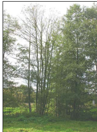
Houppier partiellement défeuillé