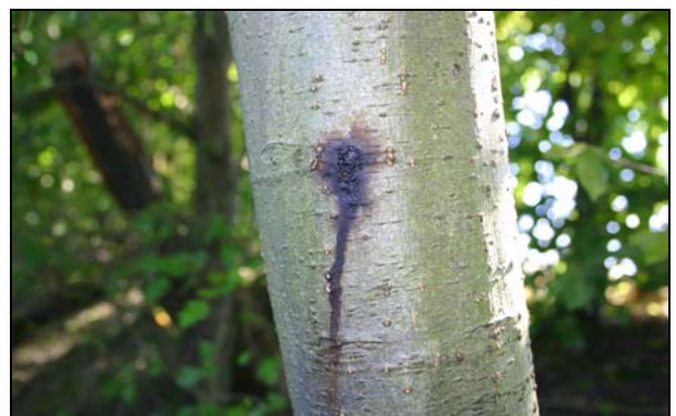
Nécrose suintante sur tronc