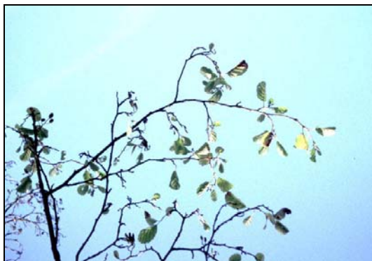
Rameaux présentant des feuilles réduites et peu nombreuses