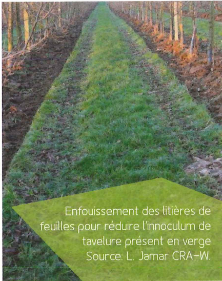
Enfouissement des litières de feuilles pour réduire l'innoculum de tavelure présent en verger