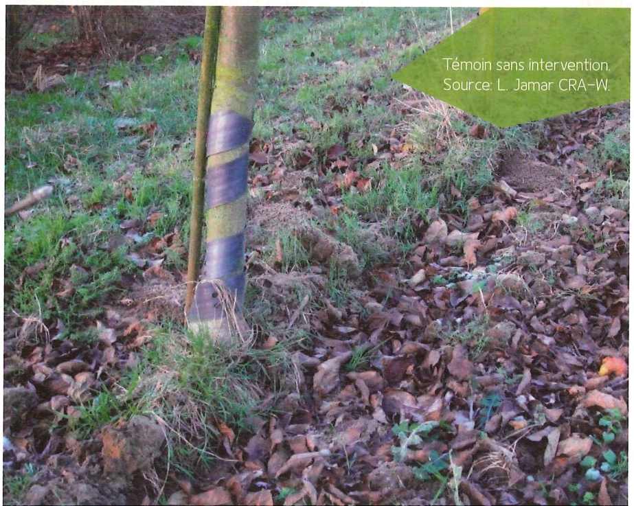
Témoin sans intervention.

Le choix de variétés tolérantes à la tavelure permet également de réduire l'usage du cuivre. Ce choix n'est pas toujours possible, notamment dans le cas de vergers en place convertis à l'AB. Par ailleurs, les variétés tolérantes à la tavelure ne sont pas forcément adaptées à toutes les conditions