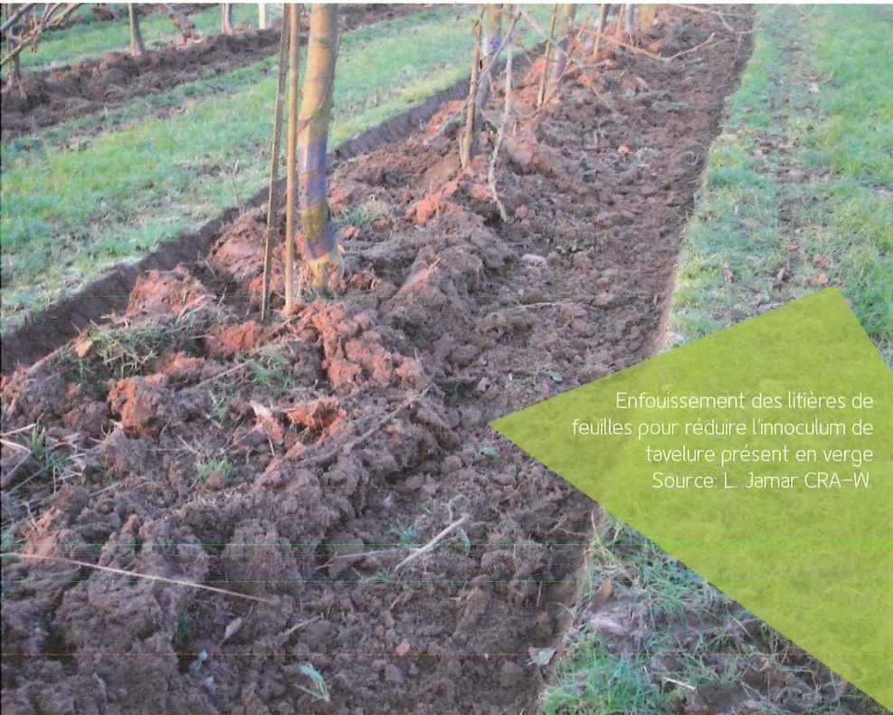
Enfouissement des litières de feuilles pour réduire l'inoculum de tavelure présent en verger

pédo-climatiques, elles peuvent aussi présenter des sensibilités rédhibitoires à d'autres maladies ou ravageurs. Les variétés de pommiers et poiriers tolérantes à la tavelure, adaptées à nos conditions et à la demande commerciale, sont encore assez rares et le programme d'amélioration du CRA-W en propose de nouvelles. Le guide TransBioFruit (Jamar et al., 2013) inclut des recommandations de variétés de pommes et poires pour l'AB.