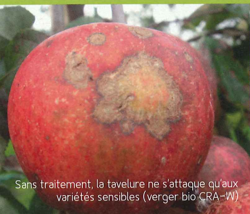
Sans traitement, la tavelure ne s'attaque qu'aux variétés sensibles (verger bio CRA-W)