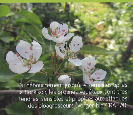
Du débourrement jusqu'à 4 semaines après la floraison, les organes végétaux sont très tendres, sensibles et propices aux attaques des bioagresseurs (verger bio CRA-W).

les substances de contact deviennent inefficaces. Un essai mené plusieurs années en verger de pommiers à Gembloux démontre que l'application de la stratégie de protection durant la phase de germination permet une bonne gestion de la tavelure avec un minimum de traitements sur la saison. En protection tavelure, les traitements préventifs peuvent se révéler inutiles si l'infection ne se déclare pas et ils doivent être recommencés si la pluie lessive le produit.