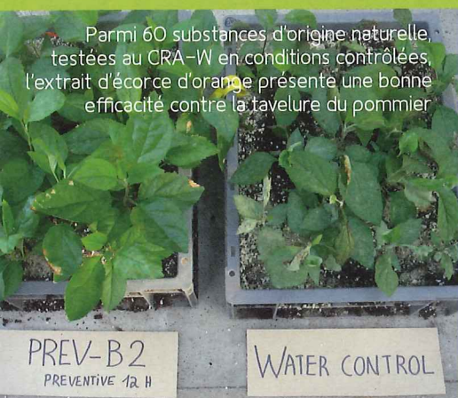
Parmi 60 substances d'origine naturelle, testées au CRA-W en conditions contrôlées, l'extrait d'écorce d'orange présente une bonne efficacité contre la tavelure du pommier