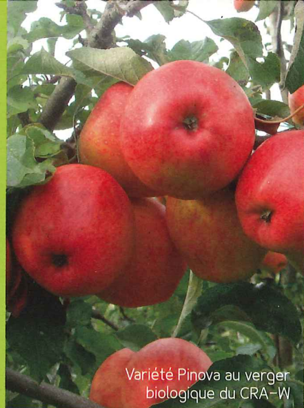
Variété Pinova au verger biologique du CRA-W