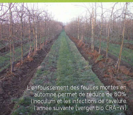
L'enfouissement des feuilles mortes en automne permet de réduire de 80% l'inoculum et les infections de tavelure l'année suivante (verger bio CRA-W)