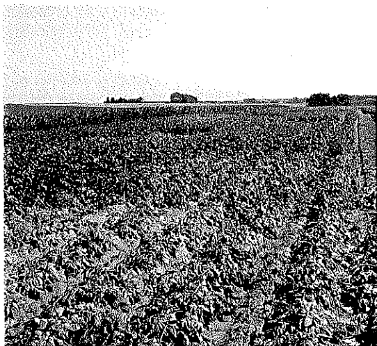
Végétation dégarnie mécaniquement pour simuler une attaque de doryphore

de nouvelles feuilles et disposant de plus de temps avant la récolte pour réduire les pertes de rendements éventuelles.