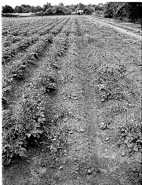
Dégâts causés par Doryphore sur le bord d'une parcelle

pomme de terre, causant des dégâts spectaculaires et marquant de son empreinte la mémoire collective des agriculteurs. Les progrès de la chimie des insecticides après la seconde guerre mondiale ont cependant permis de développer une gamme de produits de plus en plus efficaces, au point que ce ravageur a cessé d'être réellement problématique à long terme. De nos jours, les doryphores sont plutôt discrets dans la plupart des régions du pays, mais cela ne les empêche pas de pulluler localement.