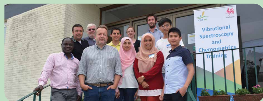
Photo de la formation de spectroscopie et imagerie organisée du 15 au 19 juillet 2019 (CRA-W, Belgium).

Le second projet ambitionne de développer des méthodes analytiques pouvant être