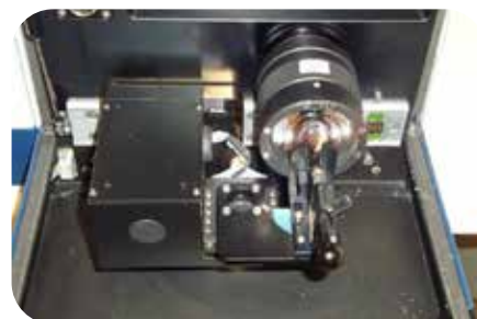
Spectromètre Raman au CRA-W et accessoire pour mesurer l'huile d'olive