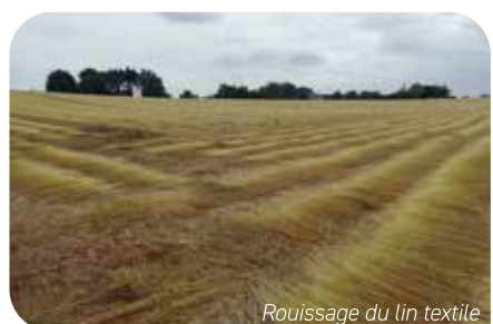
Rouissage du lin textile

La verticilliose est une maladie fongique qui affecte de nombreuses plantes dont la pomme de terre, la betterave, le fraisier, l'érable et le tilleul. Le signalement de la maladie sur lin textile est récent. Le champignon responsable, Verticillium dahliae , se retrouve dans les sols sous forme de spores de résistance pouvant survivre plus de 10 ans. Il infecte les racines peu de temps après le semis, mais c'est lors du rouissage (opération qui consiste à laisser les plants de lin arrachés 2 ou 3 semaines sur la parcelle avant récolte pour faciliter la séparation des pailles de la fibre, voir photo) que le champignon dégrade la fibre, la rendant impropre à la production de fibres longues utilisées dans la confection de textiles.