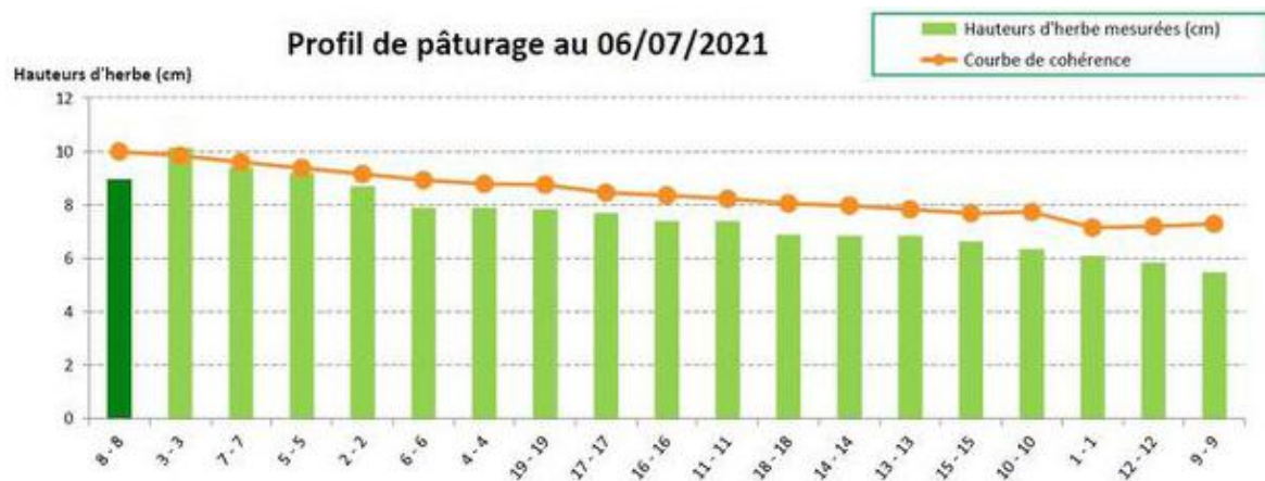
Figure 1 : exemple de profil de pâturage établi à l'aide du logiciel Pâtur'Plan avec, en abscisse, les différentes parcelles qui entrent ans le circuit de pâturage. Les bâtonnets verts représentent l'offre en herbe et la courbe orange (« courbe de cohérence ») représente les besoins des vaches. Ce profil de pâturage montre qu'avec cet agencement des parcelles dans le circuit de pâturage, l'herbe viendra à manquer légèrement à partir de la parcelle 6-6. Peut-être faut-il prévoir de compléter ?

déficit en herbe et sont particulièrement intéressantes en système de pâturage tournant. En effet, ces données permettent d'optimiser l'ordre de passage des vaches sur les parcelles ou de débrayer certaines parcelles pour la fauche grâce à la réalisation d'un profil de pâturage. De plus, avoir une idée du stock disponible en prairie permet à l'éleveur d'estimer l'ingestion en herbe et de mieux adapter la complémentation à apporter à l'étable.