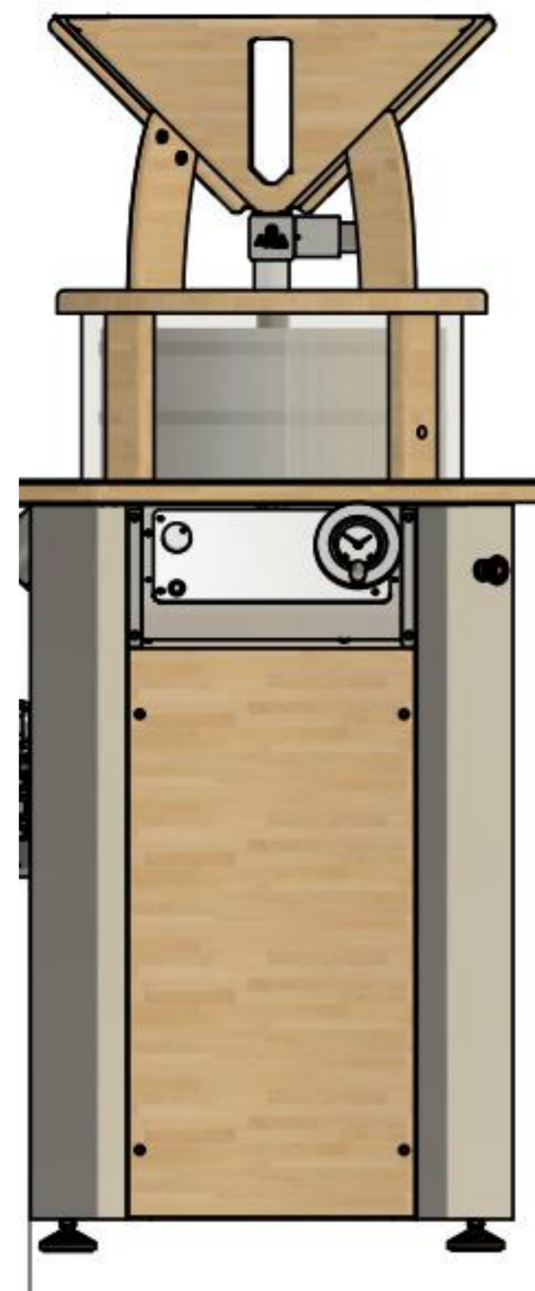
Farine ou semoule sur meule en granite