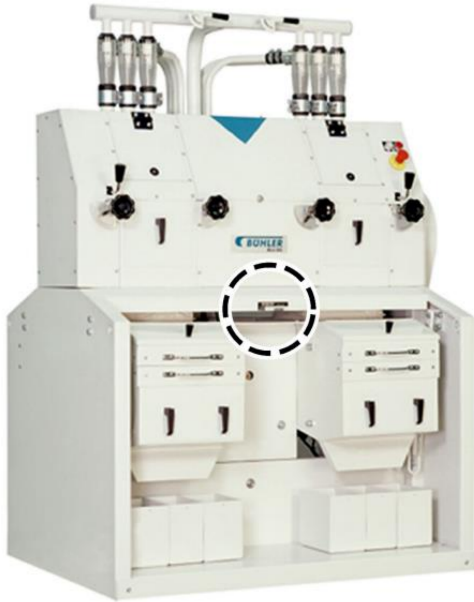
Farine sur cylindre